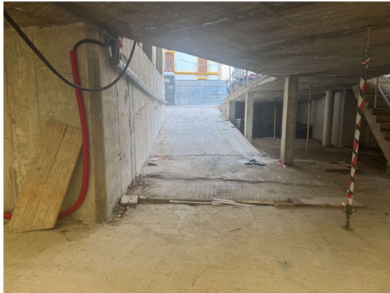
Fotografía 1. Rampa salida a exterior