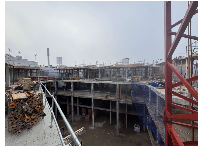
Fotografía 3. Trabajos generales de estructura