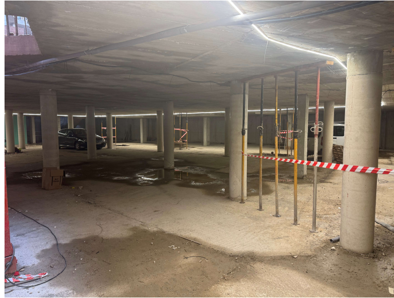
Fotografía 2. Interior planta sótano (garaje)