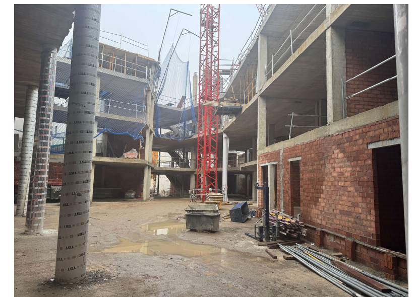
Fotografía 6. Inicio trabajos de albañilería