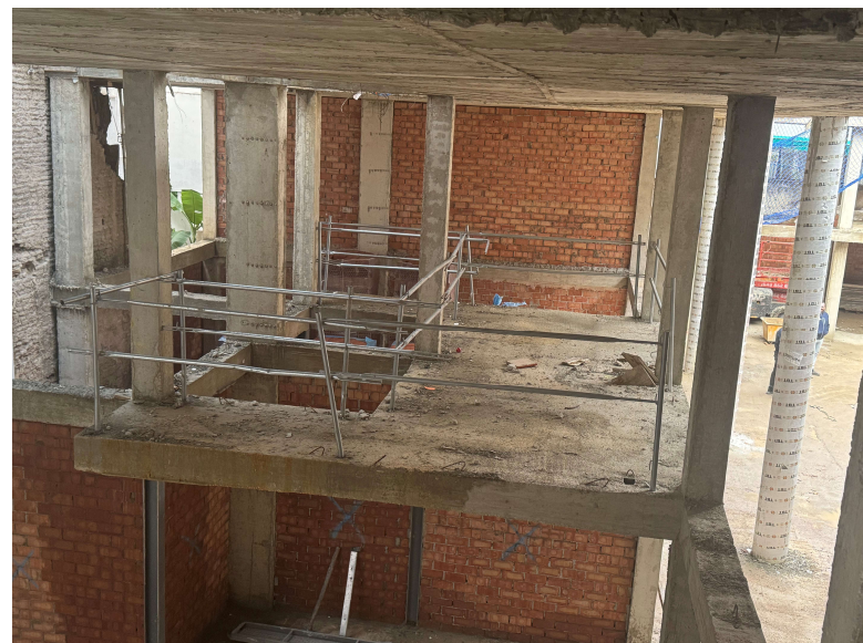
Fotografía 4. Forjados de entreplantas en viviendas taller