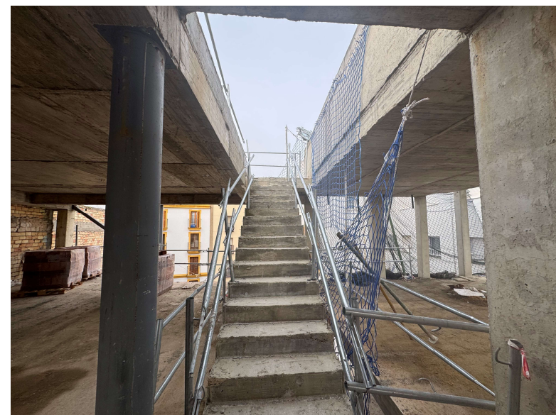
Fotografía 5. Escaleras ejecutadas in situ