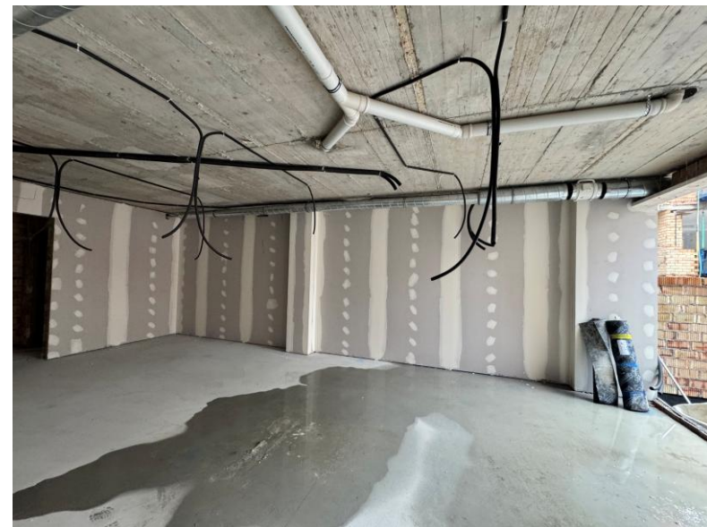
Fotografía 4. Instalaciones en gimnasio