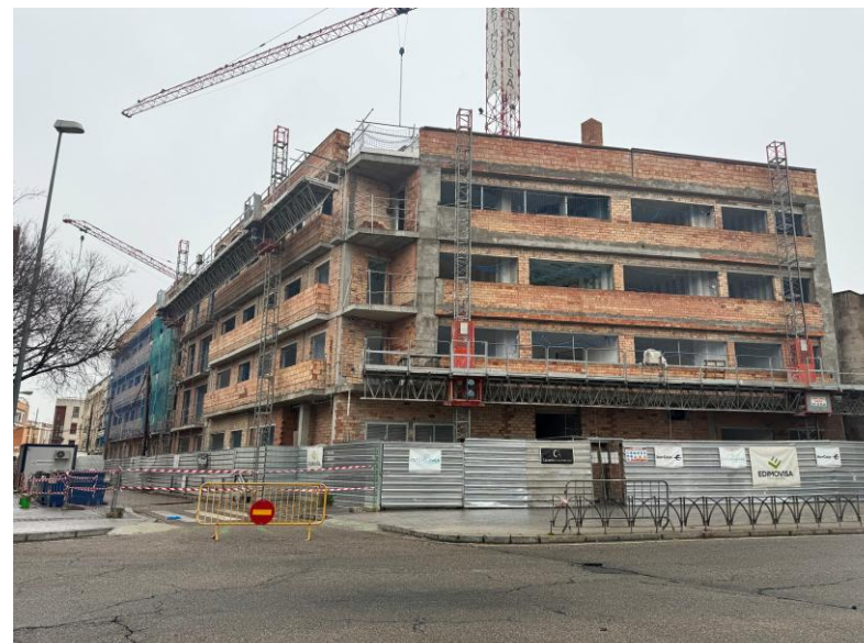
Fotografía 5. Ejecución de Fachada en Avda. Gran Capitán