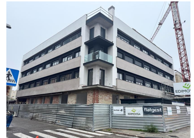
Fotografía 6. Fachadas Avda. Brillante y c/ Doña Berenguela