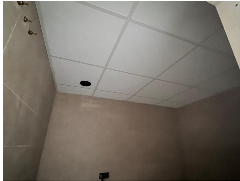
Fotografía 1. Baño con techo desmontable ejecutado