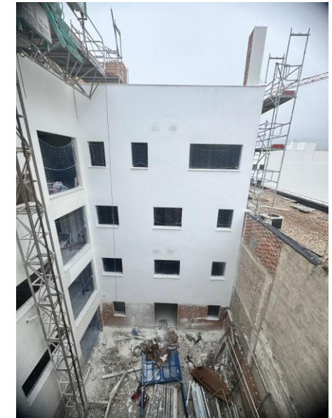
Fotografía 3. Vista de patio interior