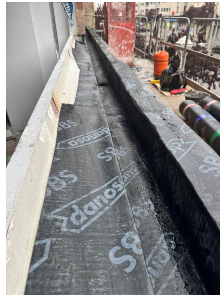
Fotografía 2. Ejecución de jardineras en Avda. Gran Capitán